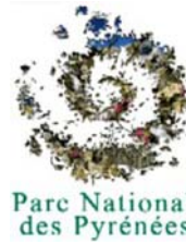
Parc National des Pyrénées

Visite du Musée du Parc National des Pyrénées à Cauterets. La visite est constituée d'une exposition permanente concernant l'organisation et le fonctionnement du Parc National et d'une projection présentant la faune et la flore qui font la richesse de ce Parc.